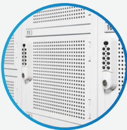
Opslag voor toeristische attracties