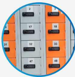
Opslag van mobiele telefoons