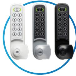
Nimbus (Model 3960)