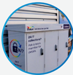
Ophalen en afleveren