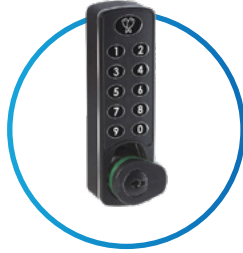
Horizon (Model 3950)