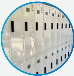
Opslag voor scholieren