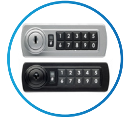
Gemini (Model 3700)