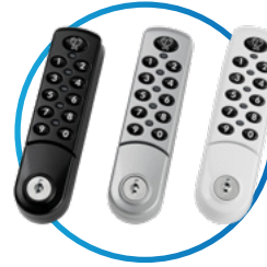
Zenith (Model 3780)