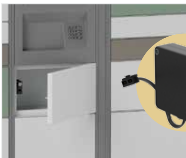
1. Verrou électronique