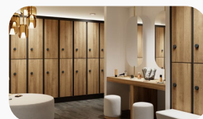
Centres de fitness et de bien-être