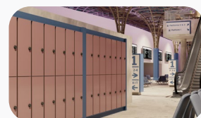
Pôles de transport Sites touristiques