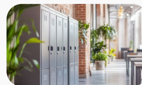
Stockage en milieu professionnel.

La Nimbus RFID avec déverrouillage programmé permet de moderniser vos serrures sans perçage ni remplacement des portes. Les empreintes de fixation communes permettent un remplacement rapide, avec un temps d'arrêt et des coûts réduits. Compatible avec les serrures Zenith ou Nimbus standards. Aucun perçage ni changement de porte requis.